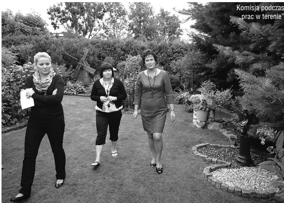
Komisja podczas „prac w terenie”

W sumie napłynęło 32 zgłoszenia z 5 gmin: Strzyżów (15), Wiśniowa (9), Fryształ (4), Wojaszówka (3) i Korczyn (1). Nadesłane zdjęcia wraz z opisem zostały włączone do prezentacji, która później została poddana ocenie przez Komisję Konkursową. W skład Komisji weszli: Specjalista Architektury Ogrodnictwa, specjalnie zaproszony na tę okoliczność, dwóch przedstawicieli Biura LGD oraz re-