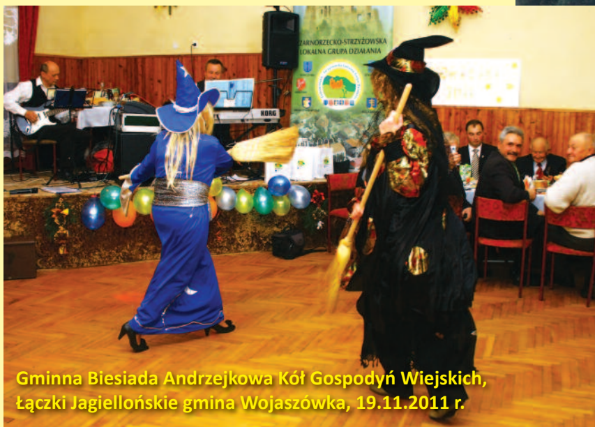
Gminna Biesiada Andrzejkowa Kół Gospodyń Wiejskich, Łączki Jagiellońskie gmina Wojaszówka, 19.11.2011 r.