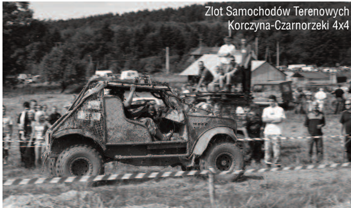
Złot Samochodów Terenowych Korczyzna-Czarnorzeki 4x4

Ostatnią imprezą sierpniową był „Złot Samochodów Terenowych Korczyzna-Czarnorzeki 4x4” (27-28.08.). Złot przyciągnął około tysiąca osób – miłośników sportów motorowych, jak też okolicznych mieszkańców.