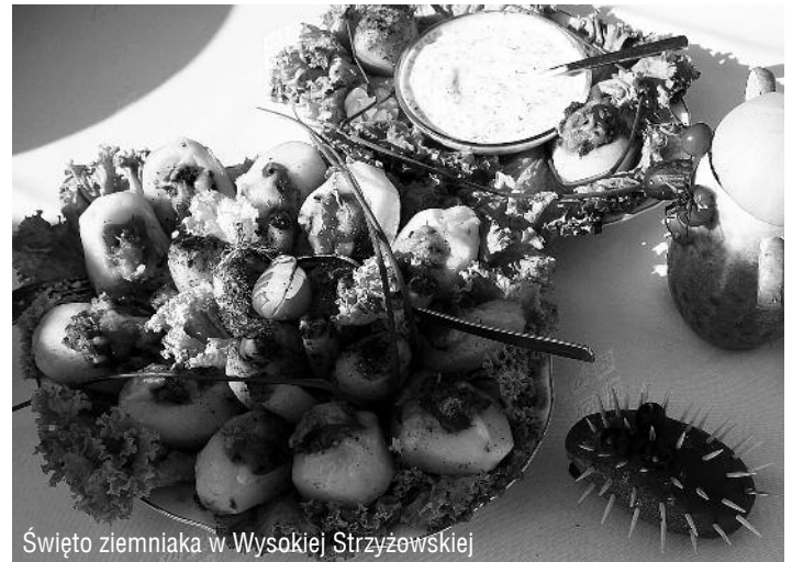
Święto ziemniaka w Wysokiej Strzyżowskiej

Dużym zainteresowaniem cieszyło się „ Święto Pieczonego Ziemniaka ” (18.09.) – impreza rokrocznie organizowana w Wysokiej Strzyżowskiej. Na przybyłych duże wrażenie zrobiła różnorodność potraw z ziemniaka – warzywa tak bardzo pospolitego i często niedoceniaonego.