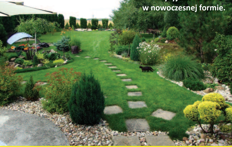
KATARZYNA HAŁAS: Tradycyjna roślinność w nowoczesnej formie.