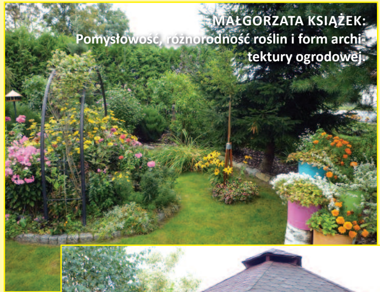
MAŁGORZATA KSIĄŻEK: Pomysłowość, różnorodność roślin i form archi- tektury ogrodowej.