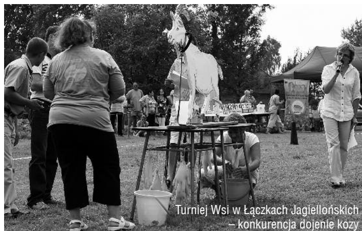
Turniej Wsi w Łączkach Jagiellońskich – konkurencja dojenie kozy

... można nazwać „miesiącem wielu wydarzeń”. Zaczęło się od czwartej edycji Turnieju Wsi Gminy Wojaszówka (7.08.) . Impreza