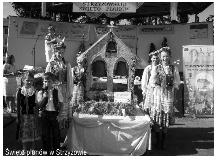
Święto plonów w Strzyżowie

Następnie 21 sierpnia w tym samym czasie odbyły się „ Dożynki gminne ” w Strzyżowie i Kombornii gm. Korczyn. W trakcie imprez odbyły się tradycyjne konkursy na najlepszy wieniec dożynkowy, występy zespołów ludowych, prezentacje plonów rolnych oraz wyrobów artystów rzemieślników. Obydwie imprezy łącznie zgromadziły prawie 1500 osób.