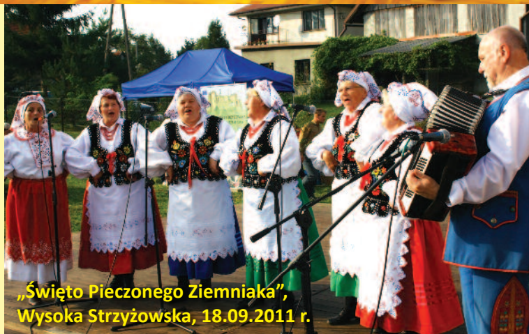
„Święto Pieczonego Ziemniaka”, Wysoka Strzyżowska, 18.09.2011 r.